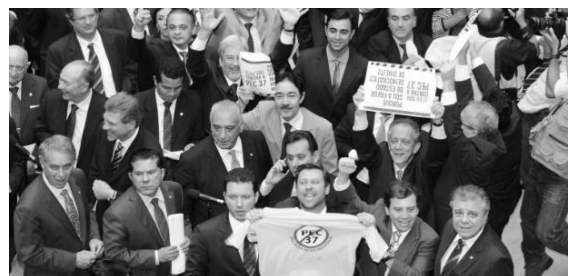
Deputados na sessão que rejeitou a PEC-37: atendendo ao clamor das ruas